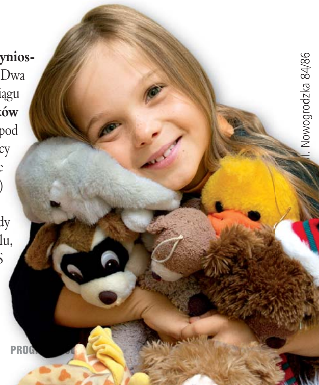
Il. Nowogrodzka 84/86

” Polacy zarabiają dzisiaj o 15% więcej niż 2 lata temu. ”